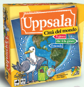
Uppsala Città del mondo

I dati presenti sulle carte provengono da varie fonti su Internet e siti istituzionali. Alcune fonti possono riportare dati diversi. Nella maggior parte dei casi è stata usata la media dei dati. Su alcuni luoghi d'interesse le coordinate si riferiscono al luogo stesso, non alle coordinate del capoluogo segnato sulla carta.