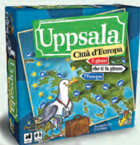
Uppsala Città d'Europa